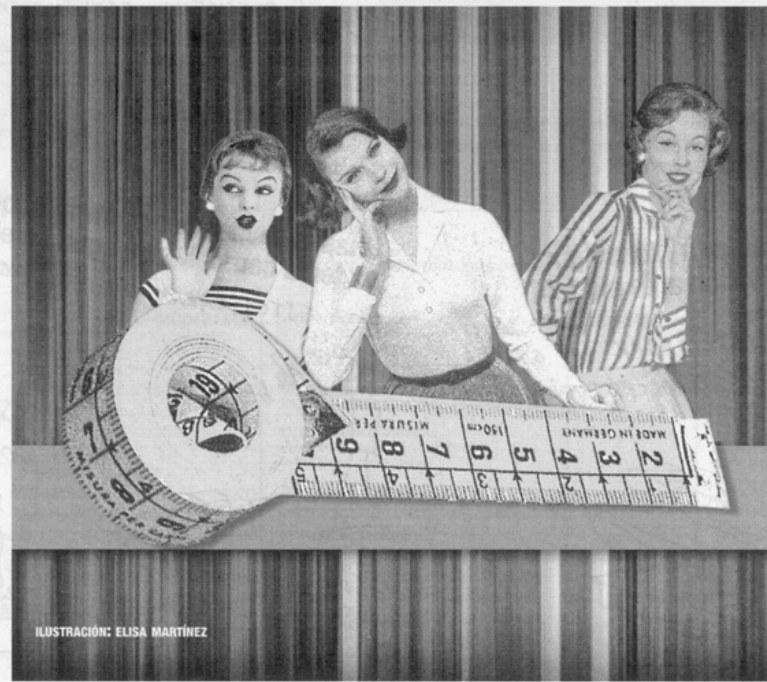
ILUSTRACIÓN: ELISA MARTÍNEZ

LAS VÍAS ACCESIBLES. La vía de la compañía de Sierra Menera, conocida como de Ojos Negros-Sagunt, con una longitud de casi 200 kilómetros es la más extensa del territorio estatal y va desde las minas de Ojos Negros en Teruel hasta el Port de Sagunt, aunque sólo está acondicionado el tramo entre el límite provincial con Teruel y Torres Torres (Valencia). En Teruel son practicables varias zonas como la de Teruel-Puerto Escandón y Puebla de Valverde-Sarrión-Albentosa-límite provincial.