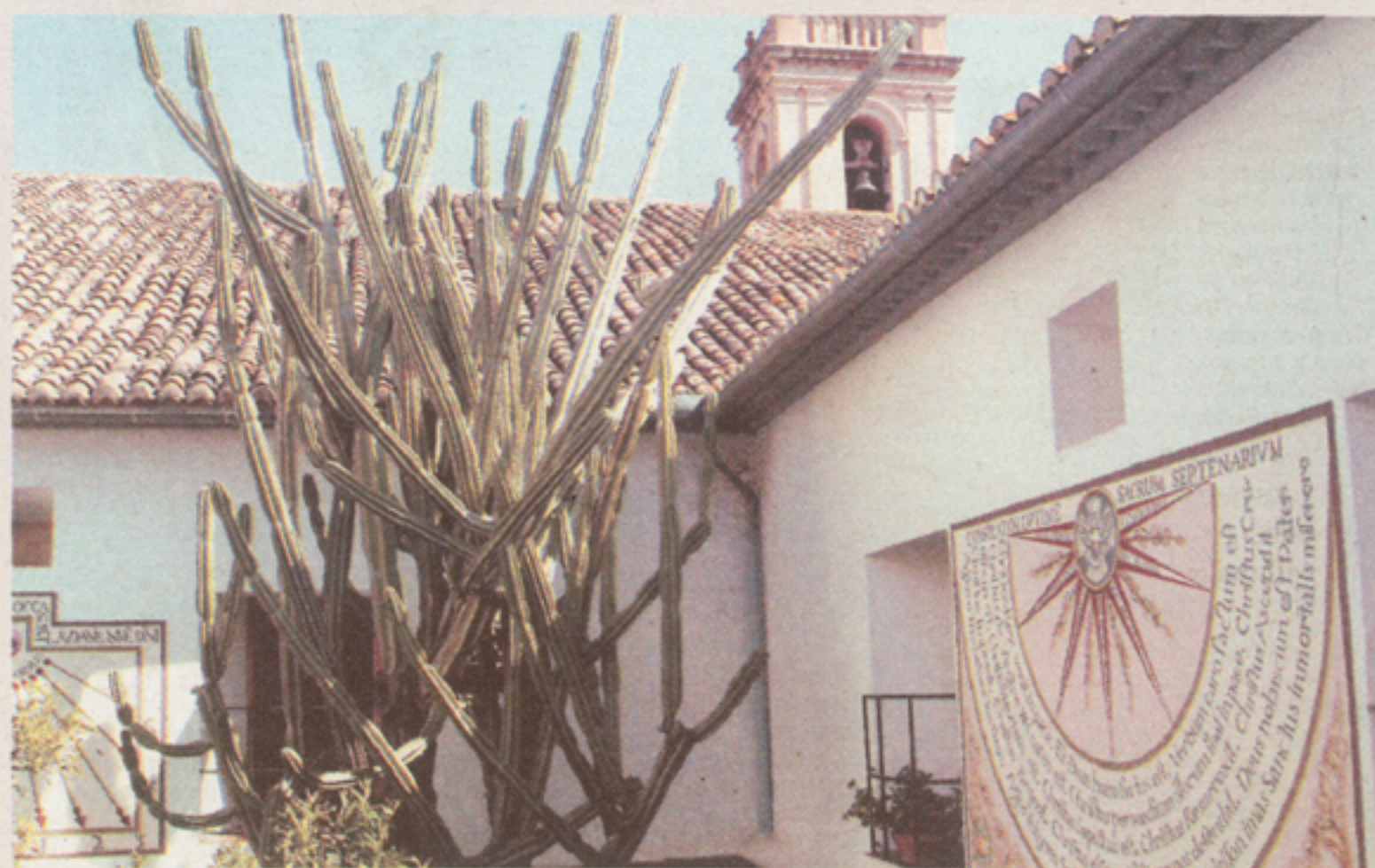
Imagen del claustro del monasterio, en el que destaca un cactus de grandes dimensiones.