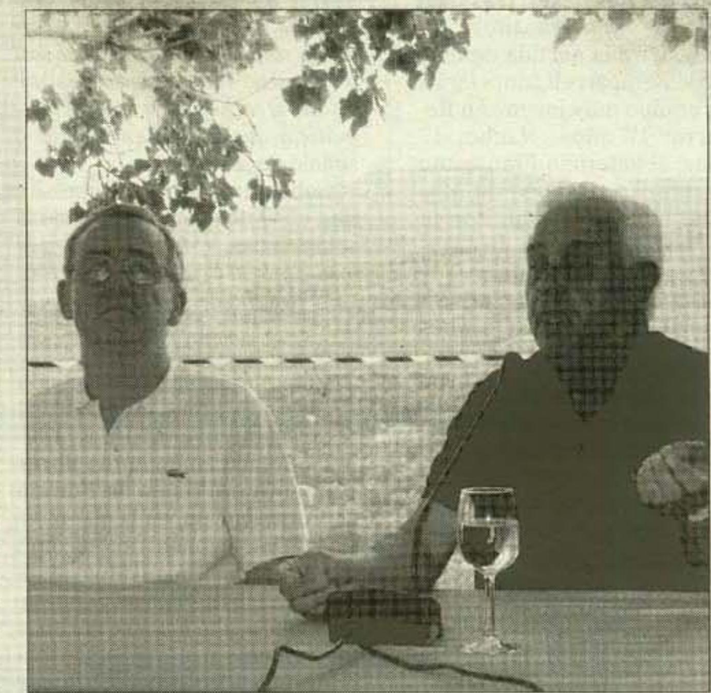
ALCALDES. Agustín Melchor y Francisco Salt.

Buena prueba de ello es el plan social paralelo que se incluye dentro del proyecto de Roig y que se compromete a la creación de 2.100 empleos -entre directos e indirectos- para los vecinos y residentes de la zona. Además, también se plantearán nuevas actuaciones a nivel cultural y social entre los promotores y los ayuntamientos que se irán desarrollando según vaya avanzando el proyecto.