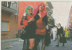
La cavalcada de disfresses recorre el poble.

DISSABTE, DIA 23 CONCERT ORQUESTA MONDRAGÓN 24:00 H. Actuación de la Orquesta Mondragón.