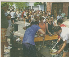
La gastronomía ocupa un lugar destacado en estas fiestas.