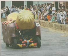
Los Autos Locos se repiten con éxito cada año.