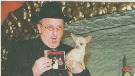
La Orquesta Mondragón animará la fiesta nocturna en Gilet.

→ La Volta a Peu y la cita con los Autos Locos fue todo un éxito y se superaron las cifras de anteriores ediciones