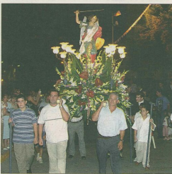
TRASLADO. La «baixa» del santo resulta muy emotiva.

■ El traslado de la imagen del patró de la localidad es uno de los actos más emotivos de las fiestas