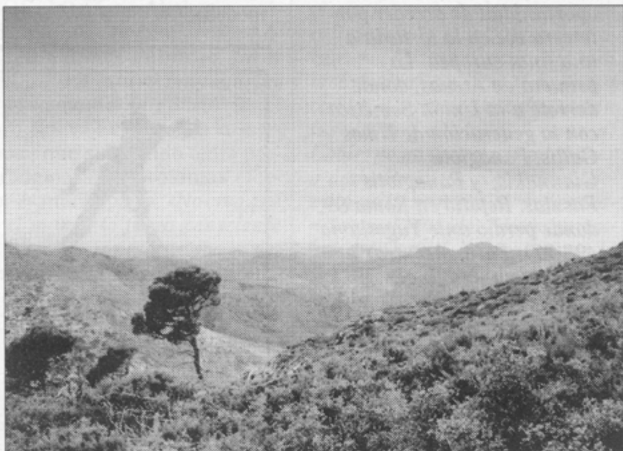
SIERRA. El proyecto permitirá un mejor aprovechamiento del suelo y no condenará al abandono los terrenos que ocuparán las nuevas instalaciones.

Se trata de lograr un mejor aprovechamiento del suelo y de no condenar al abandono los terrenos de la Baronia.