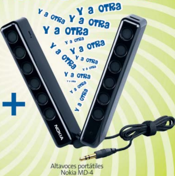
Altavoces portátiles Nokia MD-4

Ahora, sólo en Tu Tienda On line , si te vienes a movistar podrás disfrutar de tu música estés donde estés.