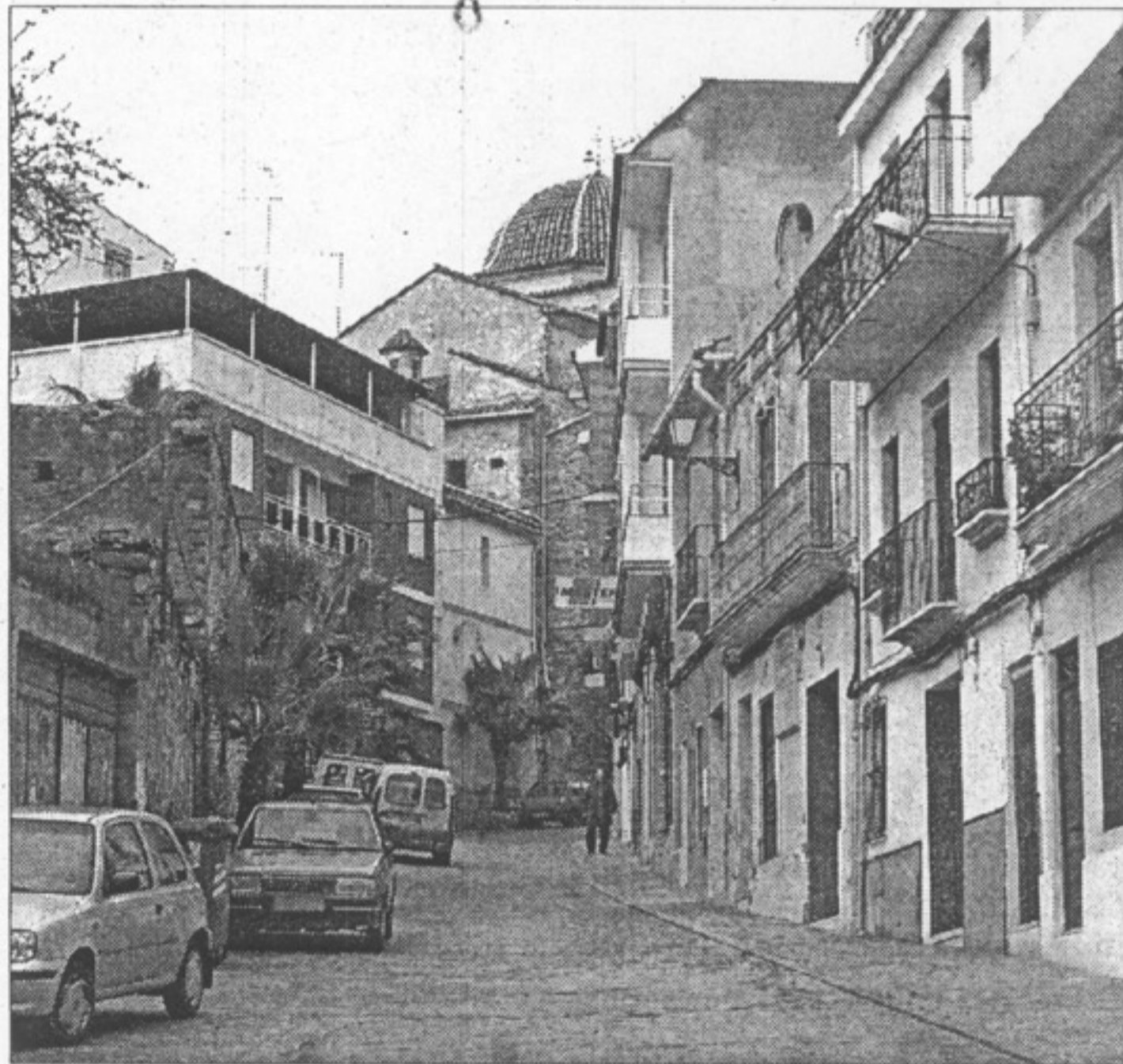
Una calle de Serra, con la cúpula de la iglesia al fondo.