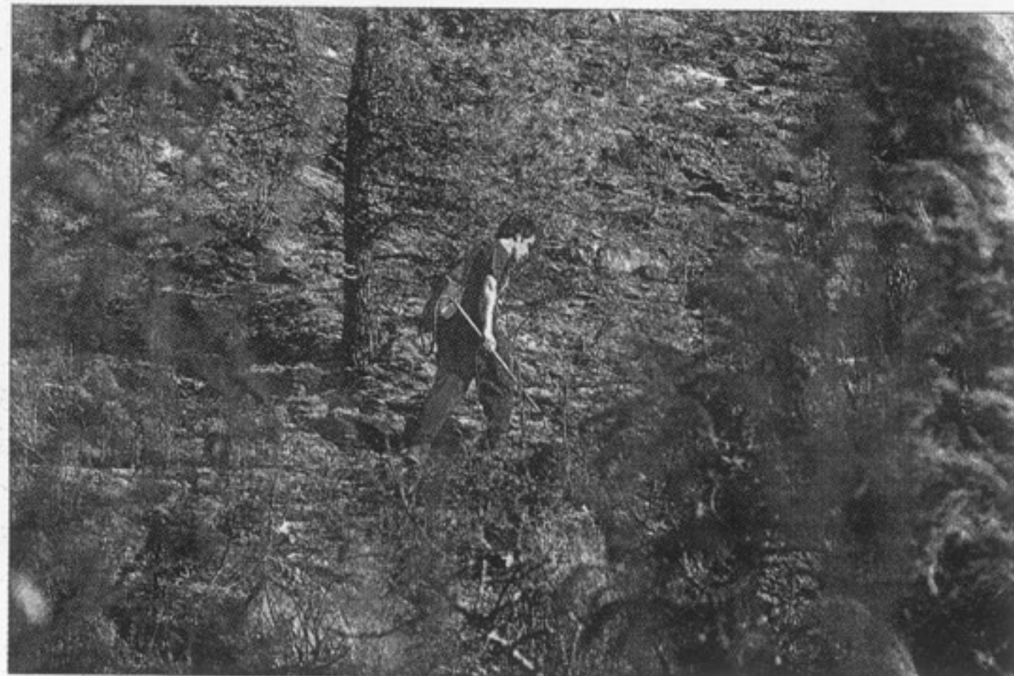
Un joven que ayudó ayer en la extinción, muy cerca de la zona de origen del incendio.

El castillo ubicado en este municipio no corrió peligro, puesto que se halla a unos 3,5 kilómetros del lugar de las llamas.