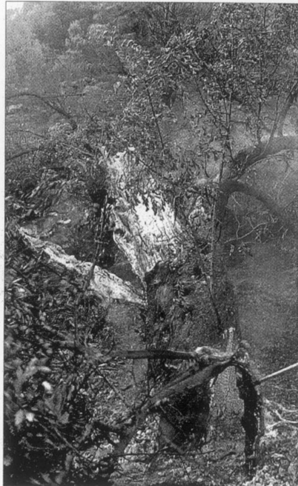
Un vecino, tratando de enfriar el tronco aún incandescente en el barranco de la Tejería, lugar en el que se inició el incendio, junto al pueblo de Olocau.

Fuentes de la Conselleria de Territorio y Vivienda confirmaron que el motivo de este nuevo desastre na-