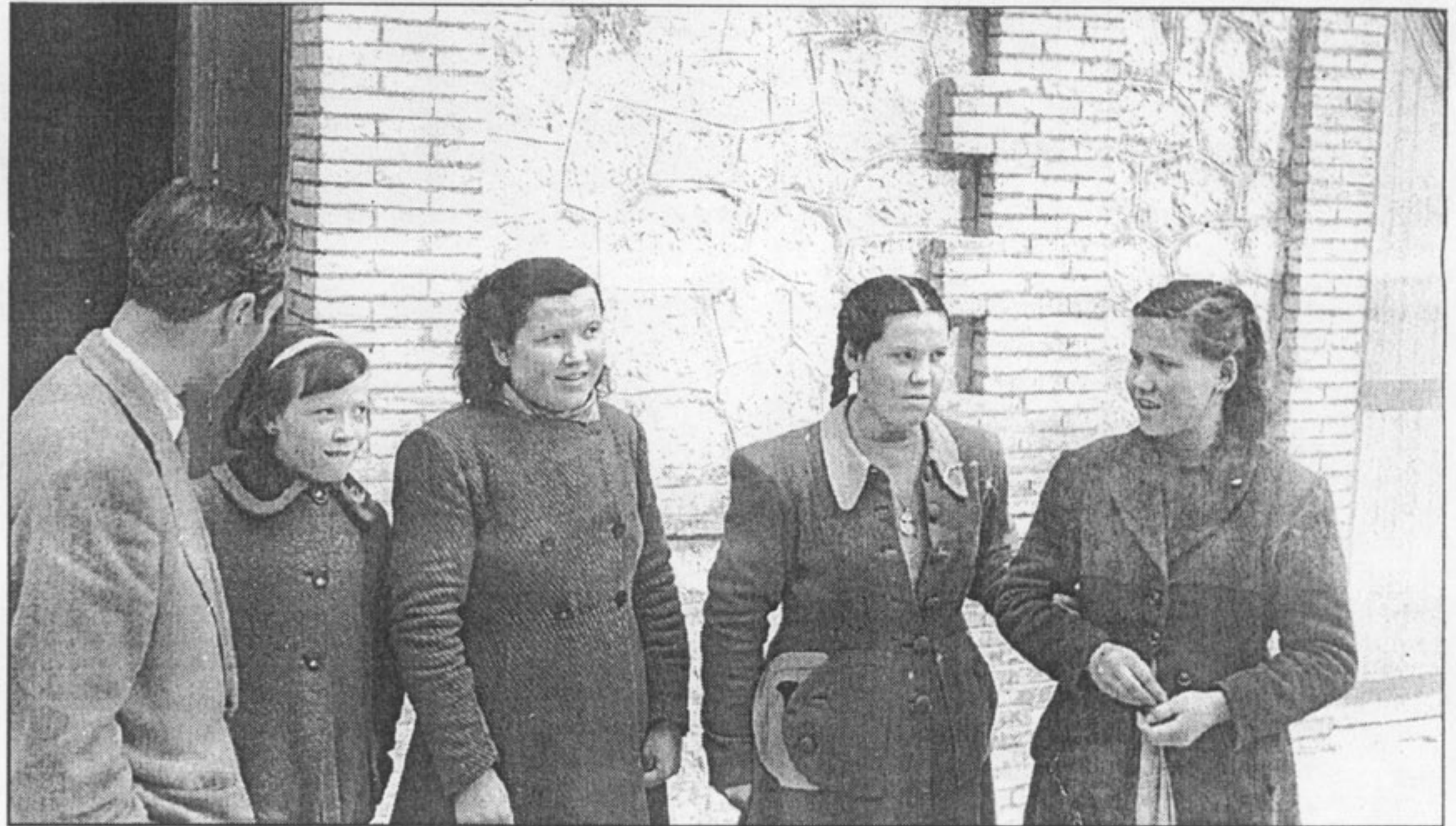
Los periodistas recibidos por los jesuitas en el patio de Fontilles. Cuatro enfermas charlando con los informadores.

des importante, el centenario del primer "llibret de falla" escrito por Bernat i Baldoví en 1855 para la falla que se plantó en la plaza del Almudín. En recuerdo de este centenario, Lo Rat Penat crea el premio extraordinario que lleva el nombre del poeta.