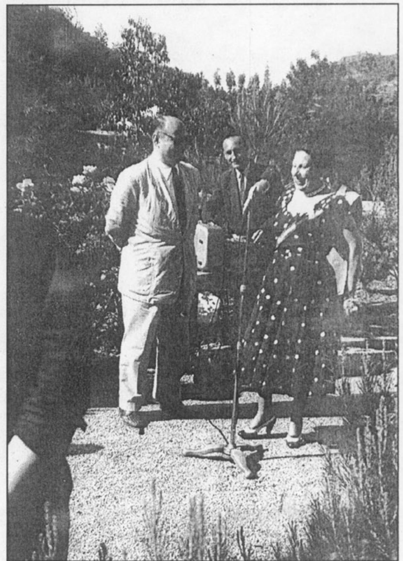
Lucrecia Bori contestando a las preguntas del señor Zara.

El hotel Tres Forques situado en un bello paraje de Serra, fue durante muchos años lugar de visita obligada de personajes ilustres y populares que visitaban Valencia, como fue el caso del popular locutor de Radio Madrid Bobby Deglané y el actor valenciano Rafael Rivelles, que también plantaron un árbol.