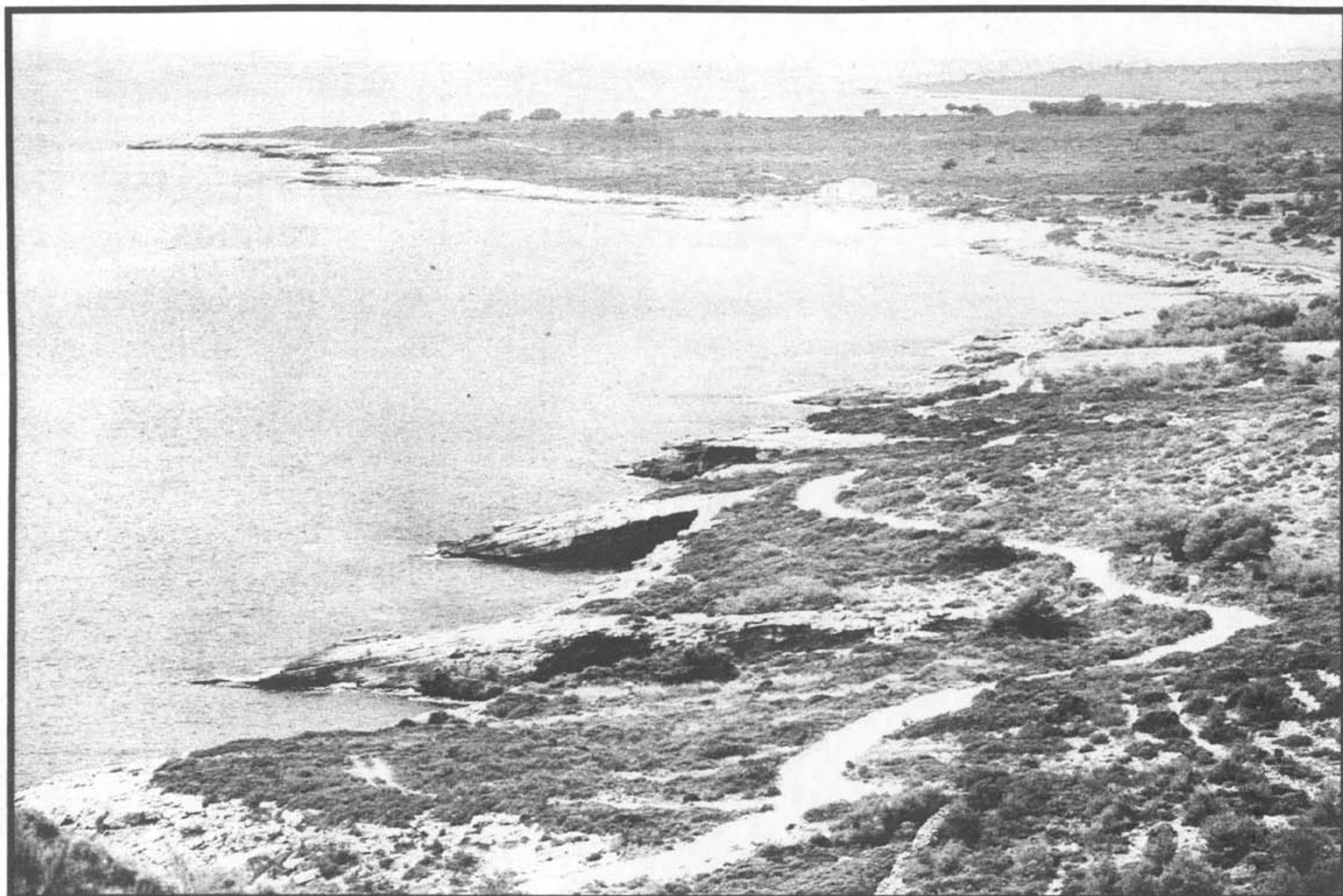
La sierra de Irta, última cordillera sin edificar del litoral valenciano. Debajo, una de las neveras que forman de los restos arquitectónicos de Mariola. Losas/Peñalba